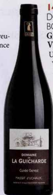
D.R. CUVÉE GENEST 2016 DU DOMAINE DE LA GUICHARDE. Généreux et sapide.