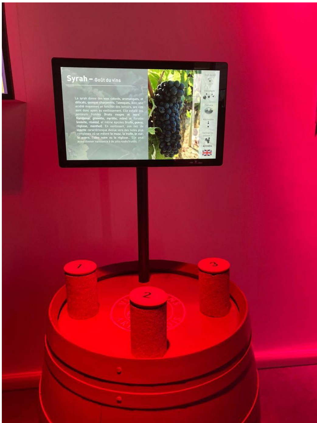
Jeu interactif des arômes dans la salle "Papilles" à l'espace Néovinum à Ruoms .