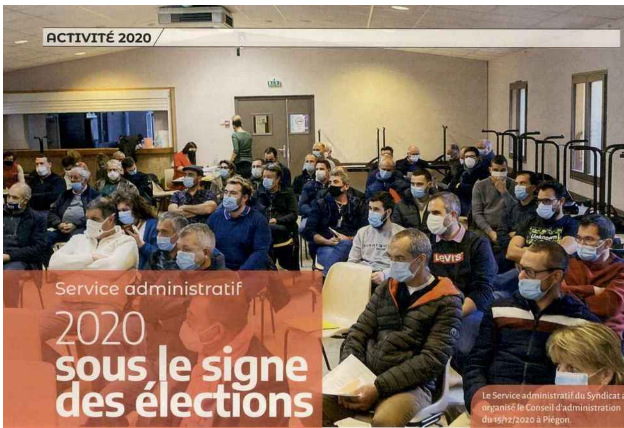
Le Service administratif du Syndicat a organisé le Conseil d'administration du 15/12/2020 à Piégon.

À nnée particulière, événement peu ordinaire ! Tous les trois ans, le Syndicat général renouvelle ses membres. En effet, l'ODG Côtes du Rhône et Côtes du Rhône Villages a procédé aux élections de ses délégués à l'assemblée générale dans un premier temps, à celle de ses administrateurs au Conseil d'administration ensuite pour enfin désigner son président lors du conseil du 15 décembre 2020.