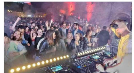
Le festival se déroule le week-end du 31 mai.

La troisième édition du festival Wondersun aura lieu dans les ruines du vieux village d'Allan, le 31 mai et 1 er juin. Avec, en exclusivité, la présence d'un DJ originaire de la Drôme provençale : Boston Bun. L'année dernière, l'évènement affichait complet et les organisateurs comptent bien rendre cette édition mémorable. C'est le rendez-vous pour découvrir la scène électro locale.