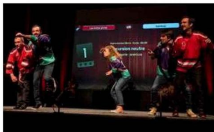
La Nuit de l'impro se déroulera le 9 mars à la salle Fontaine de Saint-Paul-Trois-Châteaux.

La Nuit de l'impro est un spectacle proposé par la troupe tricastaine de théâtre d'improvisation Les Improbiotics. Elle aura lieu à Saint-Paul-Trois-Châteaux (espace de la Gare, salle Fontaine) le 9 mars prochain de 20 heures à minuit.